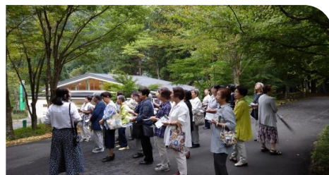
郡上市の古今伝授の里を訪ねました