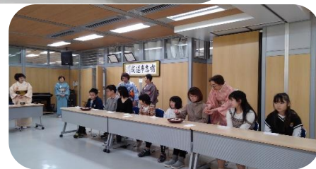
楽しく抹茶をいただきました