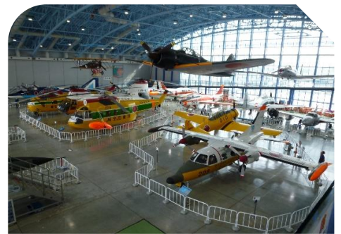
格納庫には実物の航空機が