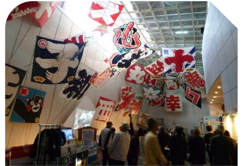
大凧が会場いっぱいに展示